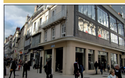
▪ Brice 31, rue de la Liberté

La boutique de prêt-à-porter masculin Brice s'est réinstallée sur deux niveaux, à l'angle de la rue de la Liberté et de la rue du Château.