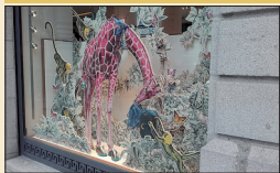
▪ Hermès 6, place Grangier

Après 4 mois de travaux, la boutique de luxe Hermès a rouvert ses portes, agrandie et rénovée. Elle s'est refait une beauté.