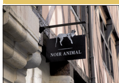
▪ Noir Animal 18, rue Verrerie

C'est une boutique de bijoux et d'accessoires dans un cabinet de curiosités, située rue Verrerie.