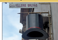
▪ Chapellerie Bruyas 65, rue des Godrans

C'est un restaurant discret qui propose une cuisine 100% maison, avec des produits locaux dans un cadre authentique.