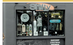
▪ Shifty - Board Shop 2, rue des Perrières

C'est une boutique située rue des Perrières, un lieu unique en son genre, entièrement dédié à la planche à roulettes, au « skateboard ».