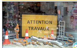
▪ Sam et les Lutins 6, rue Charrie

Cette jolie boutique indépendante pour enfants et futurs mamans propose des jouets originaux mais aussi toute la décoration pour une chambre d'enfant.