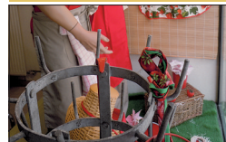
▪ Aux travailleurs Réunis 32, rue du Bourg

La vitrine est entièrement réalisée avec les équipements nécessaires aux nombreux corps de métiers. Ici, un couple de jardinier est mis à l'honneur.