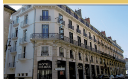
▪ Hôtel des Ducs 5, rue Lamonnaye

Cet hôtel situé à deux pas de l'Hôtel de Ville, à côté du Grand Théâtre, rue Lamonnaye, a été entièrement rénové.