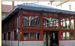
▪ Brochettes et Cie 18, rue Odebert

Le nouveau restaurant autour des halles où « tout se pique, tout se broche » s'est installé à la place de l'ancienne brasserie.