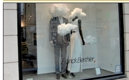
▪ Franck Berthier Place Jean-Macé

La boutique de prêt-à-porter haut de gamme située sur la place Jean-Macé propose un concept multimarques.