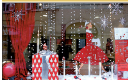
▪ Atelier Pétula Green rue Monge

Boutique-atelier où adultes et enfants peuvent s'initier aux arts plastiques, prendre des cours de couture ou fêter un anniversaire.