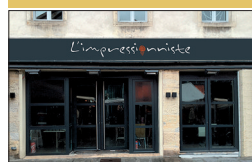
▪ L'Impressionniste 6, rue Bannelier

Installé depuis peu autour des halles rue Bannelier, le chef étoilé Jérôme Brochet se positionne entre la grande cuisine et la brasserie.