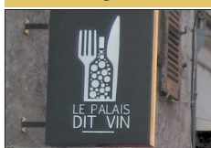
▪ Le Palais Dit Vin 74, rue Monge

C'est un restaurant discret qui propose une cuisine 100% maison, avec des produits locaux dans un cadre authentique.