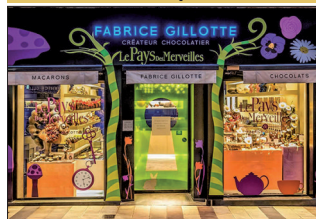
▪ Fabrice Gillotte 18, rue Odebert

Meilleur Ouvrier de France chocolatier-confiseur, Fabrice Gillotte ne cesse d'innover dans ses mises en scène pour présenter ses produits.