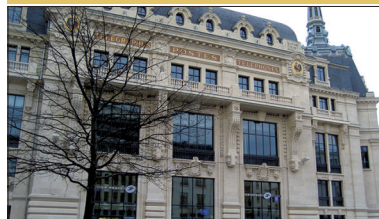
▪ La Poste Place Grangier

C'est un bâtiment monumental de style classique construit en 1909 sur la place Grangier et dont les façades et la toiture sont inscrites aux M.H. depuis 1975.