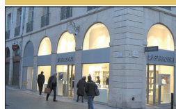
▪ Swarovski 82, rue de la Liberté

Cette boutique s'est réapproprié la devanture en habillant le sas ouvert de l'ancien commerce et en revalorisant les arcades de la rue.