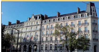
▪ Hôtel La Cloche 14, Place Darcy

18 mois de travaux ont été nécessaires pour moderniser, agrandir et rénover cet hôtel place Darcy. De conception classique, les façades sont inscrites aux M.H. depuis 1975.