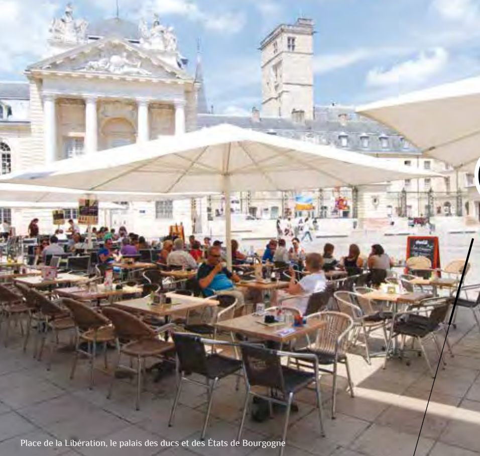
Place de la Libération, le palais des ducs et des États de Bourgogne