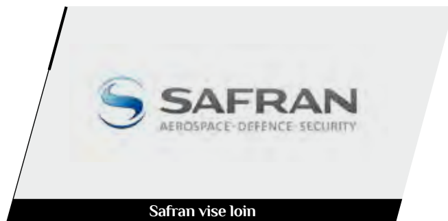
Safran vise loin

C'est dans le technopôle Mazen-Sully, à Dijon, que la jeune société récemment cotée en bourse installe son siège et son unité de production. Crossject lance sur le marché mondial le premier dispositif d'injection de médicament sans aiguille, baptisé Zeneo. Un système révolutionnaire, fruit du travail d'une équipe constituée au cœur de l'écosystème de la recherche en santé du Grand Dijon.