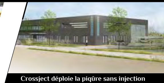
Crossject déploie la piqûre sans injection

La « Société d'emboutissage de Bourgogne » est devenue le groupe leader de l'électroménager dans le monde. Elle n'en a pas pour autant oublié sa région d'origine : depuis 2010, elle a réuni l'ensemble des équipes marketing et recherche de sa branche « culinaire électrique » dans son berceau historique, Selongey, près de Dijon. Parce que Seb a trouvé ici les compétences dont il avait besoin et une qualité de vie agréable pour ses collaborateurs.