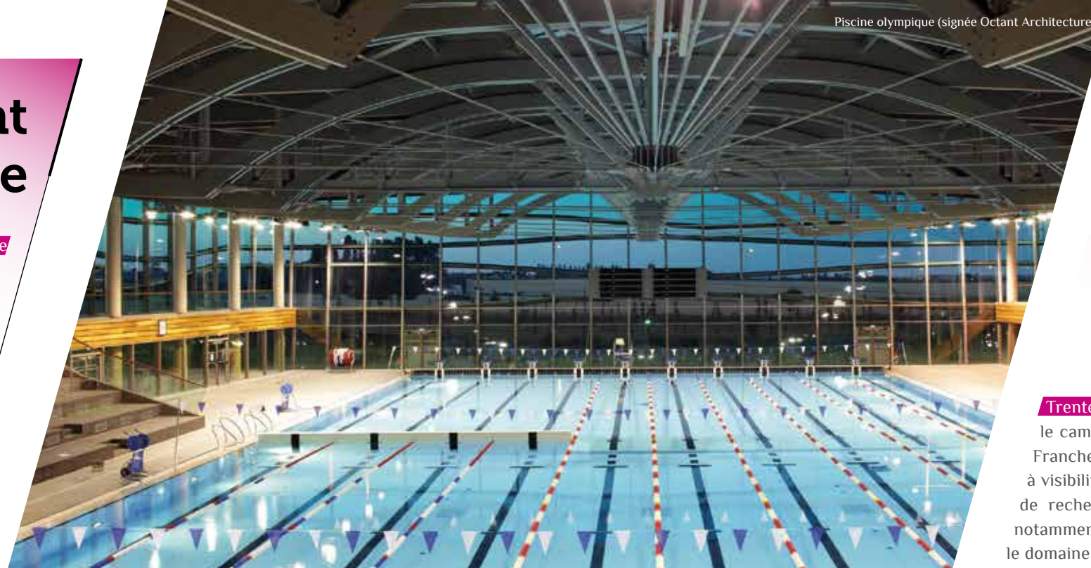
Piscine olympique (signée Octant Architecture)

New facilities for the region's metropolitan city. A tramway, new hospital, ring-road, Olympic size swimming pool, the Zénith concert and events venue, the Fine Arts museum and the contemporary art centre are all part of Dijon's breathtaking transformation over the past 15 years. The city's facilities make it the regional's unmistakable capital.