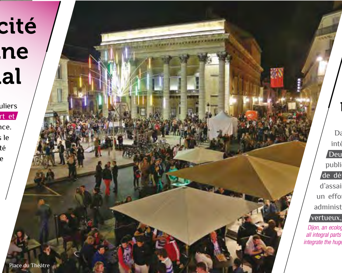
Place du Théâtre

The heart of the city for UNESCO's Cultural Heritage. Dijon is a city of art and history and its safeguarded sector stretches over almost 100 hectares, making it one of the biggest in France. Within the framework of the Climats of Burgundy's vineyards, the sector was inscribed on UNESCO's World Heritage list in July 2015.