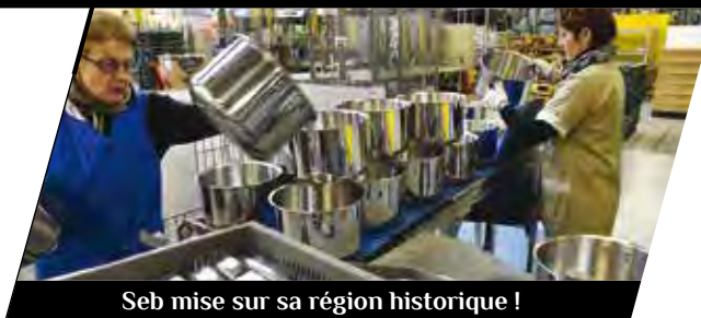
Seb mise sur sa région historique !

La « Société d'emboutissage de Bourgogne » est devenue le groupe leader de l'électroménager dans le monde. Elle n'en a pas pour autant oublié sa région d'origine : depuis 2010, elle a réuni l'ensemble des équipes marketing et recherche de sa branche « culinaire électrique » dans son berceau historique, Selongey, près de Dijon. Parce que Seb a trouvé ici les compétences dont il avait besoin et une qualité de vie agréable pour ses collaborateurs.