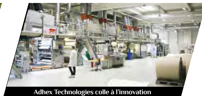
Adhex Technologies colle à l'innovation

Depuis 70 ans, les Cycles Lapierre inventent et créent des vélos reconnus pour leur qualité, leurs performances et leur caractère innovant. La marque ne cesse de s'illustrer lors des plus grandes compétitions, du Tour de France à la coupe du monde VTT. Vélos de route, tout-terrain, sportifs, à assistance électrique ou urbains : la gamme du fabricant dijonnais est complète, ainsi que le prouvera « l'expérience center » que Lapierre prévoit d'ouvrir dans sa ville natale.