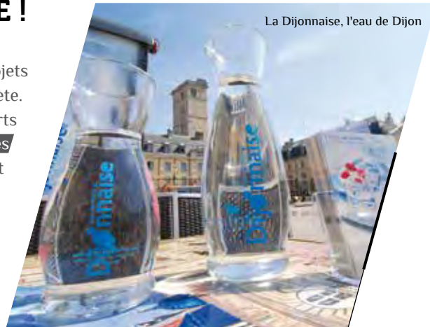
La Dijonnaise, l'eau de Dijon

Dijon, an ecological reference in France! District heating boiler system, soft mobility, environmentally responsible public buildings are all integral parts of the city. Dijon was mobilised for the COP21 in Paris, December 2015, and is a city where projects systematically integrate the huge environmental stakes of our planet.