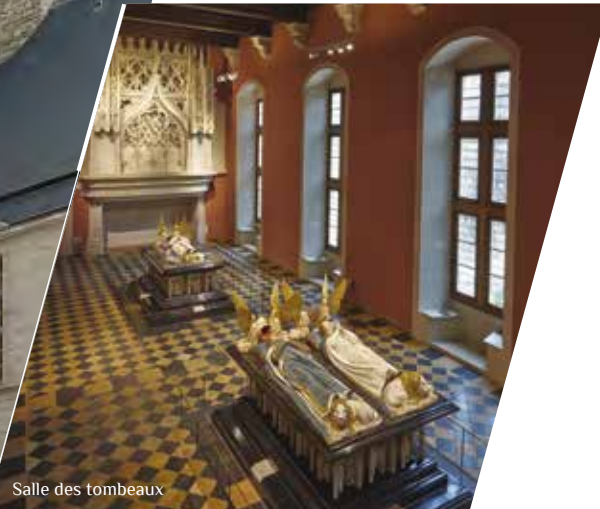
Salle des tombeaux