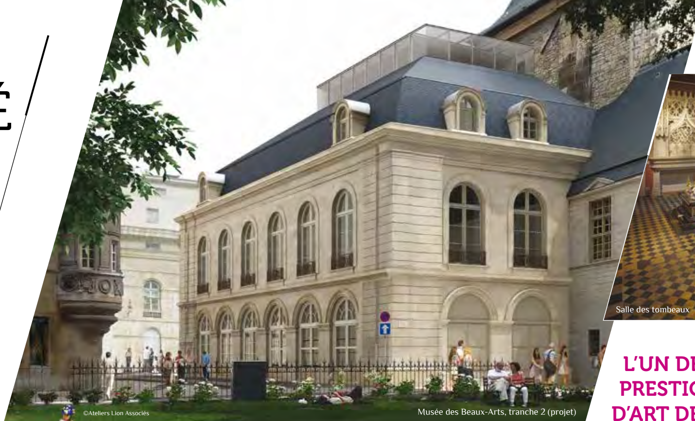
Musée des Beaux-Arts, tranche 2 (projet)