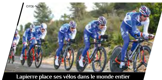
Lapierre place ses vélos dans le monde entier

Fondé et installé à Dijon depuis la fin des années 1950, le groupe Urgo est positionné sur le marché professionnel (Urgo Medical) et grand public, avec ses marques à très forte notoriété (Alvityl, Juvamine, Humex, Mercurochrome...). Présent dans plus de 50 pays, il a réalisé 628 millions d'euros de chiffre d'affaires en 2015. Il déploie une force de frappe R&D considérable pour innover et s'est diversifié en 2015 dans les nouveaux métiers de la santé avec le rachat de Sonalto (appareils auditifs).