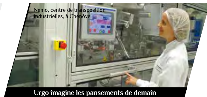
Urgo imagine les pansements de demain

Le site dijonnais de Safran est le seul au monde où l'on maîtrise les technologies de viseurs pour l'air, la mer comme la terre. Un site industriel de haute technologie dans le domaine de l'optronique, au cœur d'une région qui porte une forte tradition historique autour de l'image – c'est à un Dijonnais que l'on doit l'invention du Pan Cinor (zoom à compensation optique).