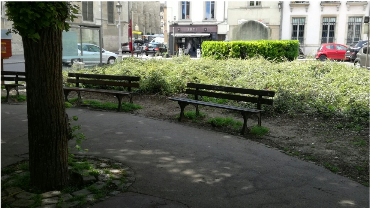
Bancs Place Saint Michel