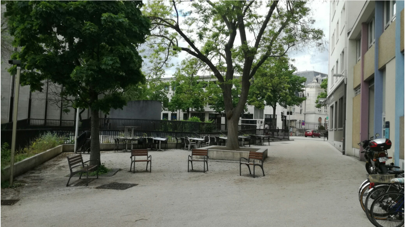
Fauteuils place Javouhey