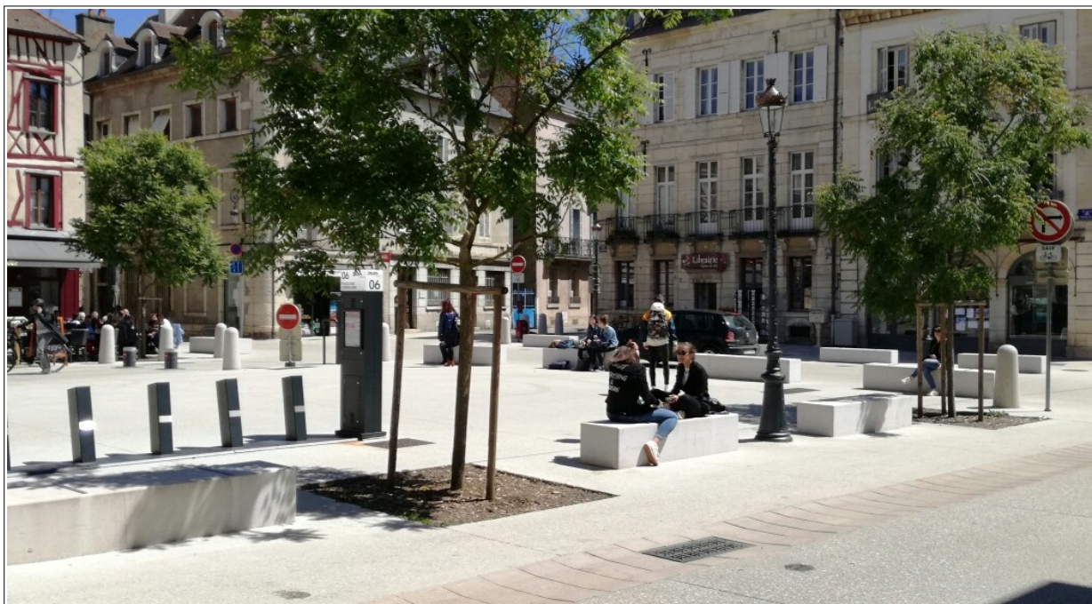
Bancs en pierre place des Cordeliers