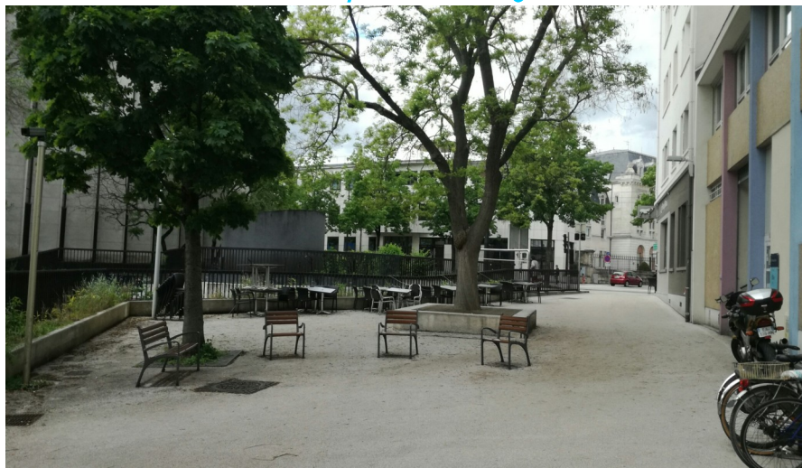
Fauteuils place Javouhey